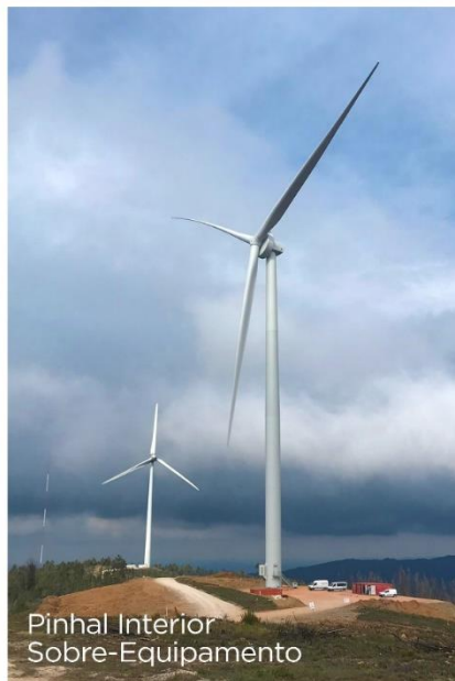
Pinhal Interior Sobre-Equipamento